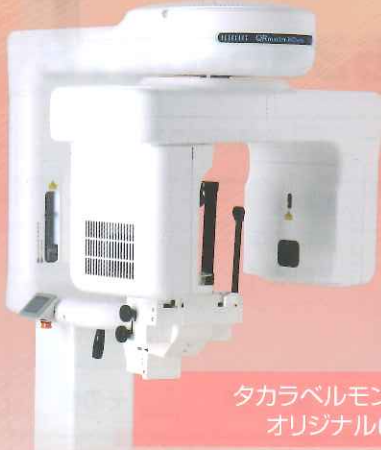
タカラベルモント オリジナルCT