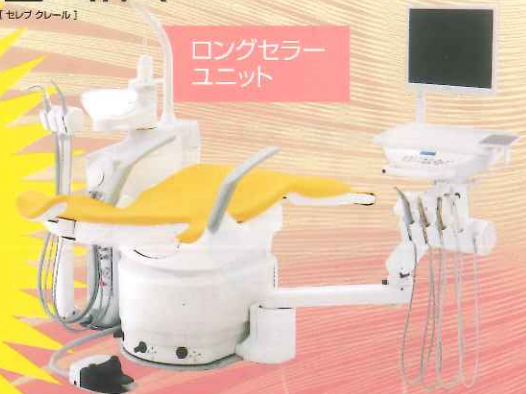
ロングセンサー ユニット