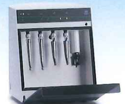
ルブリナ2 歯科用ハンドピースメンテナンス装置