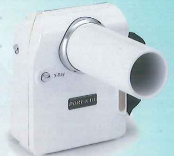
ポートエックスIII ポータブルX線装置