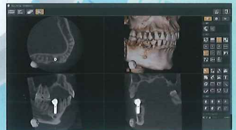
i-Dixel 総合画像処理ソフト