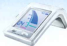
ルートZX mini 歯科用根管長測定器