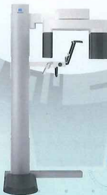
ベラビュー X800 歯科用デジタルパノラマ・セファロ・CT X線装置 ■医療機器認証番号 228ACBZX00008000