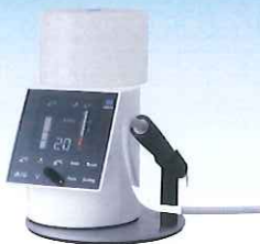
ソルフィーフ 歯科用超音波スケーラー