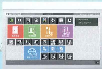
DOC-5プロキオンII デジタルオフィスコンピューター