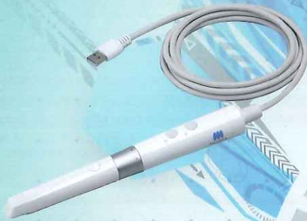
ペンビューアー 口腔内カメラ

そのシームレスな接続環境、クイック&スムーズな操作環境が業務を効率化し、患者さんとの双方向コミュニケーションを創出。確かな信頼関係を構築します。