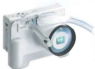
オーラルショットVII 口腔内撮影用コンパクトカメラ