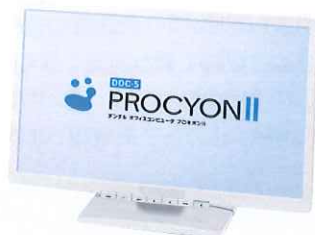
DOC-5プロキオンII デンタルオフィスコンピューター