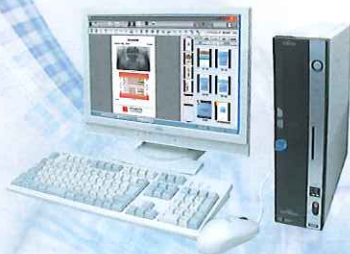
Trinity Pro 患者プレゼンテーション用ソフト