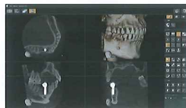
総合画像処理ソフト